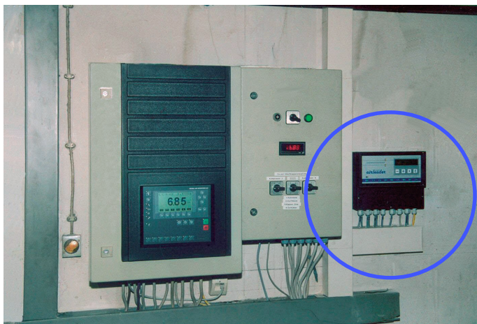
Die AIRLEADER-Steuerung leistet einen entscheidenden Beitrag für die Wirtschaftlichkeit der Druckluftstation