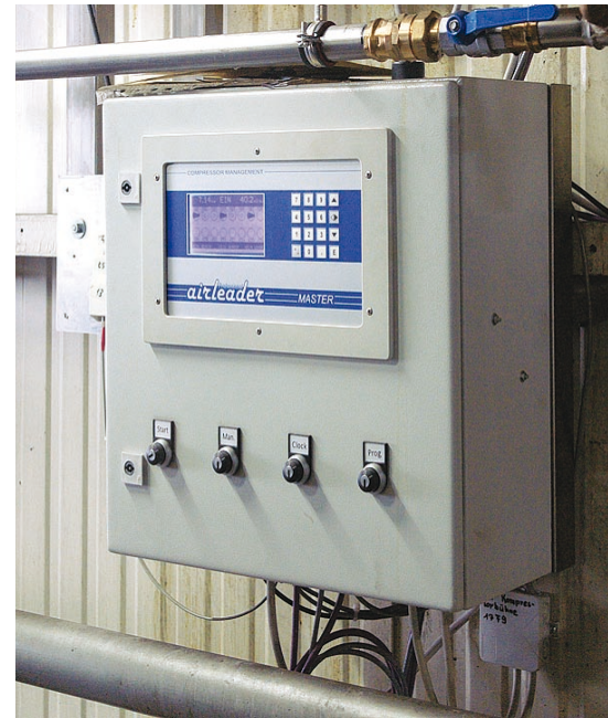
Die airleader-Master-Steuerung steuert und überwacht alle sieben Kompressoren in den drei räumlich getrennten Druckluft-Stationen